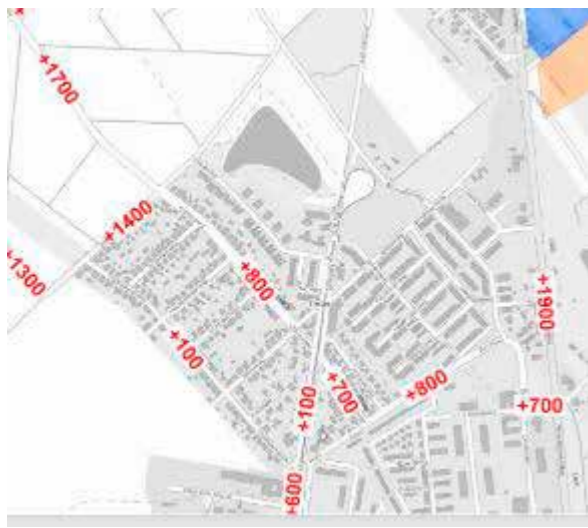
Verkehrszunahme durch Baugebiet Zentrum III Neureut (Kfz/24 h)