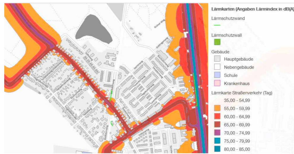
Fachpläne: Lärmkarte Straßenverkehr Tag Quelle 3 (s.u.)