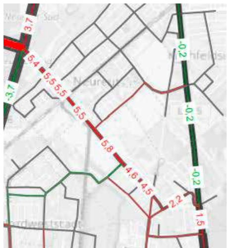
Verkehrszunahme durch neue Rheinbrücke mit Anbindung an B 36 nördlich Klärwerk (1.000 Kfz/24 h) Quelle 2 (s.u.)