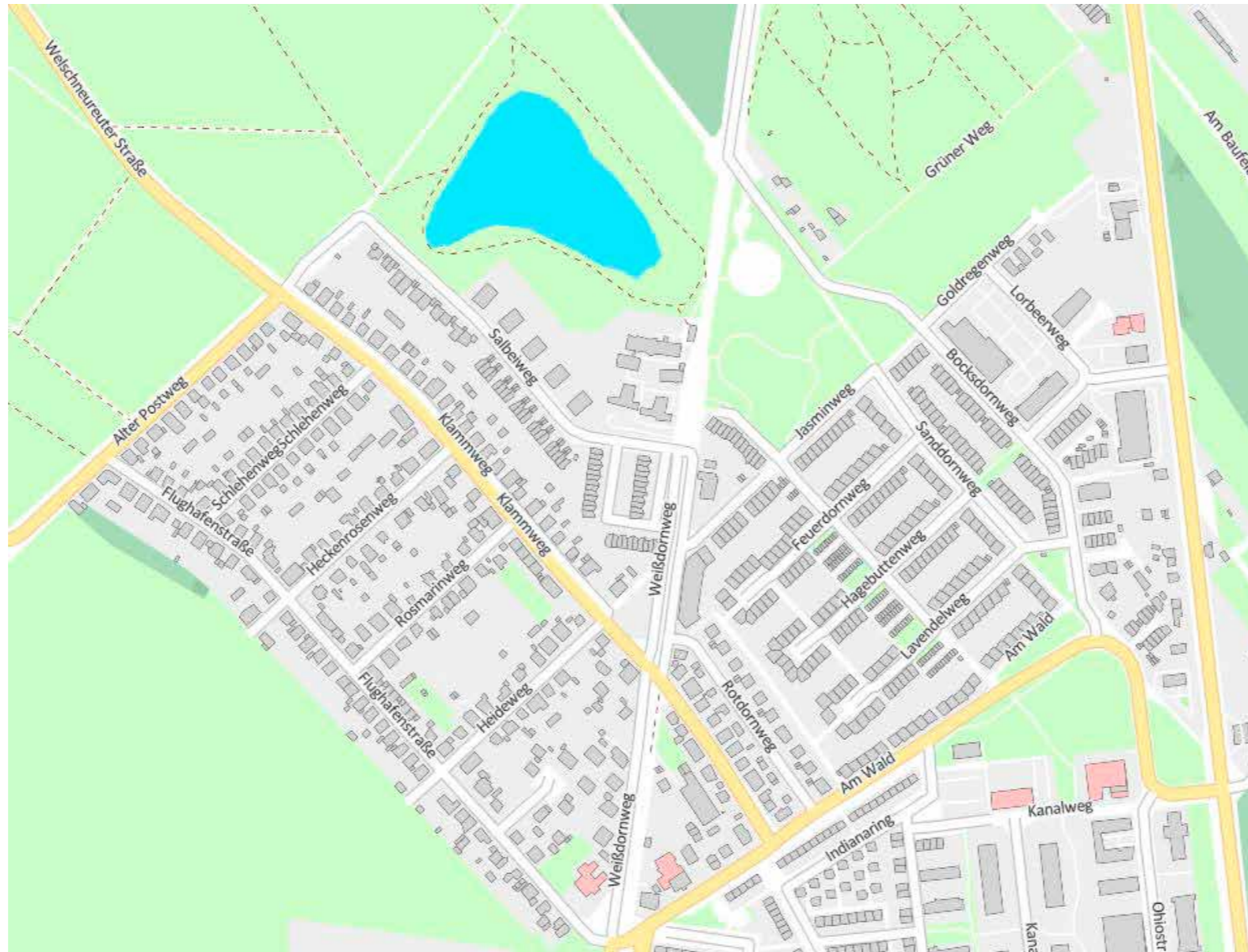
Basisdaten und Hintergrundkarten: Stadtplan Quelle 3 (s.u.)