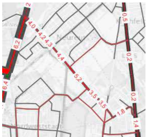
Verkehrszunahme durch neue Rheinbrücke mit Anbindung an B 36 südlich Klärwerk (1.000 Kfz/24 h) Quelle 2 (s.u.)