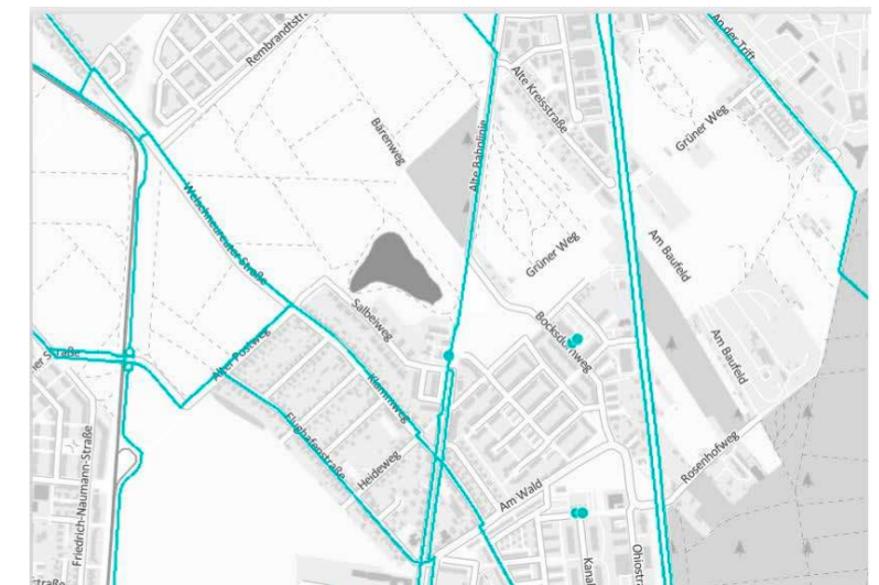
Verkehr: Radverkehr Quelle 3 (s.u.)